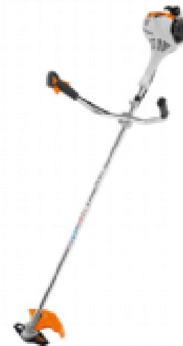
STIHL Motorsense FS 55

exkl. MwSt. zzgl. Versandkosten € 149,99 Motorleistung: 2 kW (2,7 PS) Gewicht: 26.5 kg Schnittbreite: 42 cm