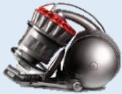
DC33c Origin Plus