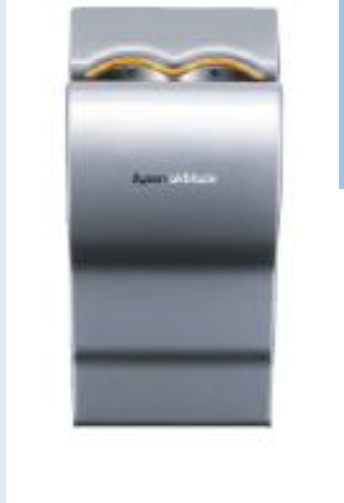
Dyson Airblade Tap (AB11 - Wandmontage)