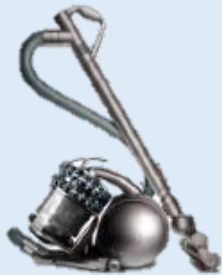
DC52 Animal Turbine