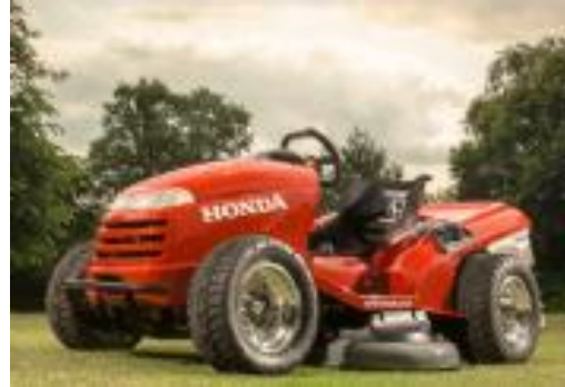
HONDA Aufsitzmäher HF 122 S

Mähfläche bis ca. 1200 m 2 , Schnitthöhe stufenlos von 30 – 95 mm, 7,1 kg. Grundausstattung: Auto Mower Ladestation, Begrenzungskabel, Netzteil. Gewicht: 7,1 kg