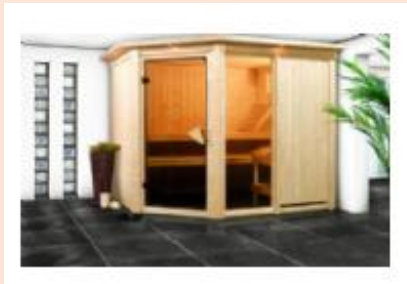
Karibu Sauna Fiona 1