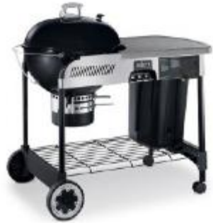
Moderner Kugelgrill „Space“