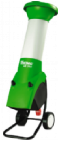
VIKING Gartenhäcksler GE 345