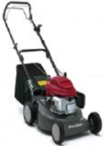
HONDA Rasenmäher JRG 465 CSX