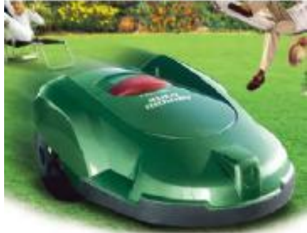
HUSQVARNA Auto Mower